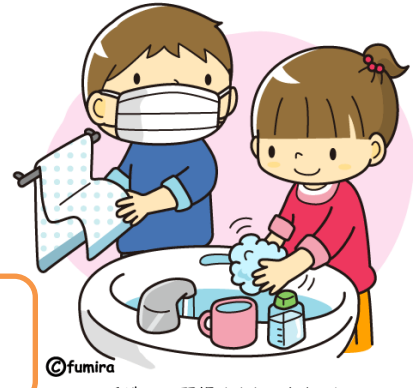
手洗いが習慣化されてきました

登校前の検温 つばのある帽子 ネッククーラー 汗ふきタオル 十分な水分(お茶とスポーツドリンクなど) スカート不要 荷物の軽減 登下校時のマスクは不要 ランドセルには予備のマスク