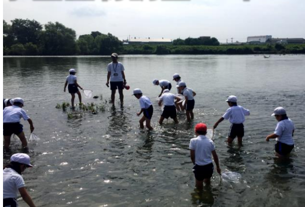
揖保川の水は冷たくて気持ちよかったです

兵庫県内全ての小学3年生で実施することとなっている「環境体験活動事業」の一環として,西播磨県民局より3名のゲストティーチャーをお迎えして水生生物調査を実施しました。揖保川の浅瀬に入り,一人一人が網を持って石の裏側や草の生えているあたりを調べました。タイコウチ,モクズガニ,カワニナ,カワトビケラ,ドロムシ,コオニヤンマのヤゴ…。学校に戻ってからは,指標となる生物をまとめました。考察の結果,揖保川は「ややきれいな水質」と判定されました。わたしたちの大切な自然を守るために何ができるのか,子どもたちは考えていきます。