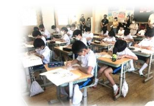
参観日のがんばり