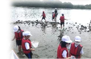
川や海での体験活動